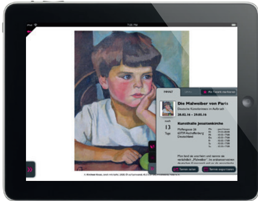
Beispiel Präsentation mit Grundeintrag II auf dem Tablet